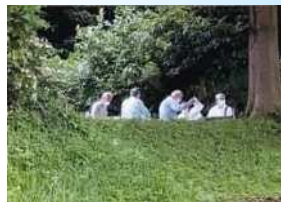
会議中 一の丸いきいきクラブ