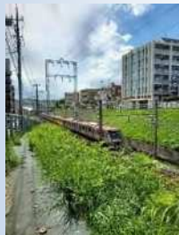
青空が似合う田園都市線 佐々木 晶