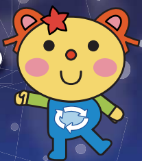
かわさき3R推進キャラクター かわるん