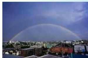
未来の架け橋 宮崎 信男