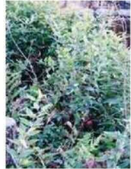
▲ やぶは刈り取りましょう