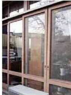
▲ 窓の開口部には網戸を!