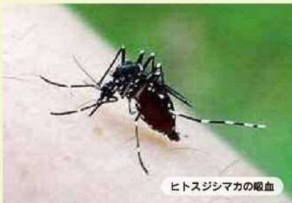
ヒトスジシマカの吸血