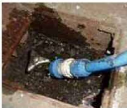
▲ 水の溜まった埋設型散水栓