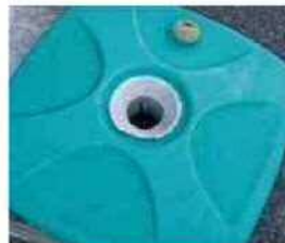
▲ 旗立て 支柱立て