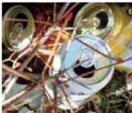
▲ 放置された空き缶