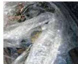
▲ 水の溜まったビニール