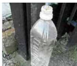
▲ 放置されたペットボトル