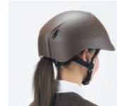
髪型が崩れないタイプ