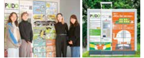
ラッピングされたオープン型宅配便ロッカー PUDOステーション

市民や事業者が環境に良いアクションを起こす文化やライフスタイルの形成を目指す脱炭素プロジェクト。先行的取組として「宅配再配達削減」の推進・普及に取り組み、6月～8月にかけて、宅配便ロッカーの利用を促進するキャンペーンを実施しました。