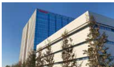
イノベーション・パレット外観

市民と躍動！スポーツを通じた地域交流も スポーツ分野でも注目を集める東芝。都市対抗野球の名門「東芝ブレイブアレス」や、ラグビーリーグワン2023-2024シーズンで初優勝を飾った「東芝ブレイブルーパス東京」が、子ども向けスポーツイベントなどを通じて、今後も地域交流を深めていきます。