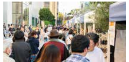
来場者で賑わうしんゆりフェスティバル・マルシェ

三井不動産は、市制100周年で強まった地域のつながりを活かし、今後も持続的なエリアマネジメント活動を行うことで、しんゆりの魅力をさらに伸長させ、サステナブルなまちにするための取組を推進します。