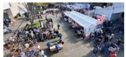
「おだきゅうFamilyFunフェスタ2024」 イベント会場

登戸駅、向ヶ丘遊園駅や新百合ヶ丘駅でも、まちづくりが進められており、小田急電鉄は今後も川崎市などと連携を深め、未来を担う子どもたちが将来誇りをもって暮らせる沿線を目指して取組を推進します。