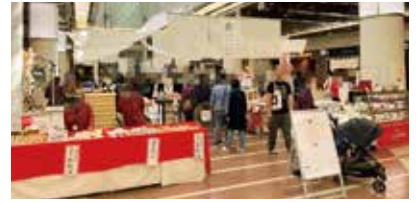
物産展イベント「かわむすのおんがえし」

この街のベストサポーターであり続けるために 昨年度の創立100周年を機に、「お客さま」「職員」「金庫」「地域」の「未来」に続く共存共栄を新たな経営理念として制定した川崎信用金庫。「この街のベストパートナー」であり続けるために、中小企業の販促売上支援など様々な経営サポートから、若年層への金融教育、地域を盛り上げる貢献活動まで多彩な取組を通じ、川崎とともに発展を続けます。