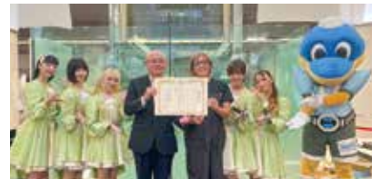
自慢の逸品を来場者が投票で選ぶ「逸品グランプリ」表彰式