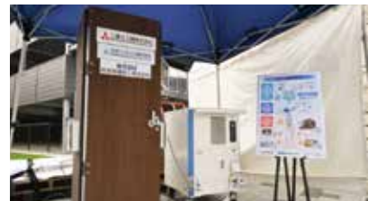
水素吸蔵合金タンクのケース(左)と燃料電池(右)