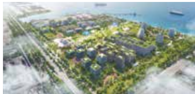
2050年想定扇島地区のイメージ

地域とともに新たな挑戦 JFEと川崎市が共催する「ふれあい祭り」は2005年から始まった地域に根付いたイベントで、毎年多くの市民が集い、地域とのつながりを大切にしている取組の一つです。市民や行政、関連企業と連携し、地域とともに歩んできたJFEスチール東日本製鉄所は現在、時代の大きな転換点に立っています。その中で、長年の鉄づくりで培った経験を武器に、変わらぬ誇りと情熱を携えて、次の100年に向けた新たな取組に挑戦します。