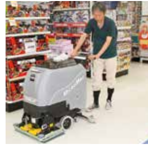
← ワックスの剥離作業

創業100年を目指して川崎を盛り上げる 地域になくならない環境先進企業として成長を続ける和光産業では、近年、川崎のプロスポーツチームのサポートに力を入れ川崎を盛り上げるとともに、子どもたちから選ばれる100年企業を目指し、未来への取組を進めています。