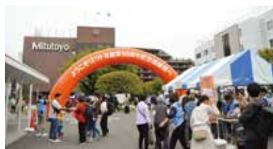
ミットヨ創業90周年記念感謝祭

90年の歴史に変わらぬ「測る」技術への思い 創業当初からの「世界最高品質のものづくり」「強いこだわりを持った技術」で、現在のグローバルカンパニーとしての立ち位置を確立したミットヨ。2034年の100周年という次の大きな節目に向け、新たな価値を提案するソリューションカンパニーとして進化すべく、今後も「測る」という課題に向き合い取組を進めます。