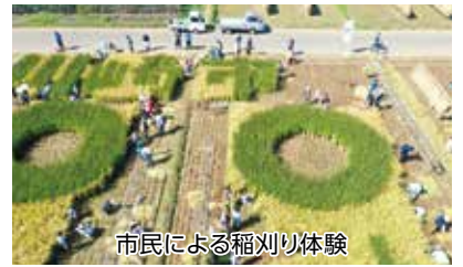
市民による稲刈り体験