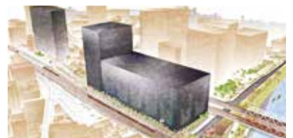
新アリーナを含む複合施設のイメージ

沿線の魅力高めるnewcalプロジェクト 京急電鉄では、新しいローカルのあり方を地域と一緒に生み出し、その地域ならではの新しい魅力を発見し、より多くの人に届けていく構想「newcal(ニューカル)プロジェクト」を展開しています。川崎では京急本線八丁畷駅前に地域交流拠点を開設し、まちの人たちに使ってもらえる場を作って活性を図っています。今後も大師線沿線や、川崎大師の歴史、多摩川の魅力などをいかしたエリアマネジメントの取組を推進します。