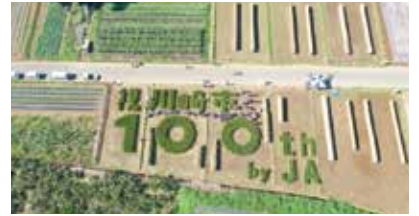
ドローンで撮影した「田んぼアート」

都市農業の魅力、次の100年に—— 都市農業の課題の一つは「農地の維持」。市内の農地も減少の一途をたどっており、その主な要因は後継者不足です。一方で、農地と消費者が近いのが都市農業の魅力、市民を農業に巻き込み、新たな展開や可能性も秘めています。まさに、田んぼアートもその一つです。JAセレサ川崎では、市民と共存しながら子どもたちにも農業を知ってもらえたらと、職員が出向いてジャガイモやサツマイモなど野菜の栽培体験や稲作体験を実施するなど、小学校や地域住民を対象とした食農教育にも力を入れています。未来の消費者となる子どもたちに農業の魅力を伝え、身近に感じてもらうと取組を進めるJAセレサ川崎。「持続可能な都市農業を残そう」を理念の一つに掲げ、「次の100年も、農業をいかした川崎であってほしい」と願っています。