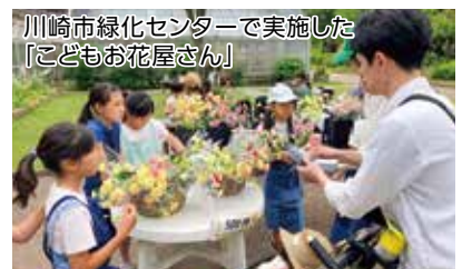
川崎市緑化センターで実施した 「こどもお花屋さん」

「WE ARE GREEN」 東急不動産ホールディングスでは「WE ARE GREEN」をスローガンに、「誰もが自分らしく、いきいきと輝ける未来」を目指し、環境経営を推進しています。グループ各社の多様な取組を通して、まちで暮らす方々が緑を身近に感じ、健康で笑顔のある幸せな生活を送っていただけるような環境をこれからも提供し続けていきます。