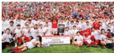
リーグワン初優勝を飾った東芝ブレイブルーパス東京