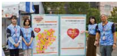
能登への応援メッセージを囲む総務部担当と若手メンバーの皆さん